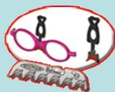
Пластинки, подходящие для 6 типов носа